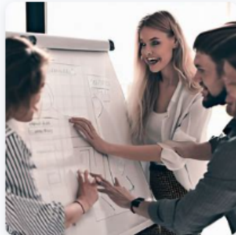
"people working together on a project with a whiteboard"